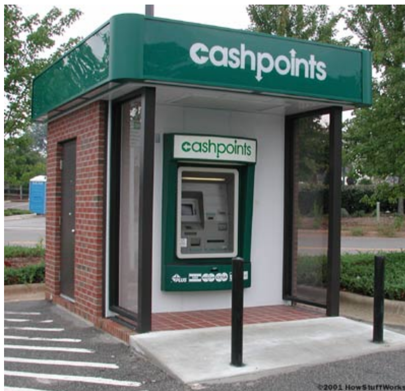
نمایی از یک کیوسک خودپرداز در یک پارک

چنانچه مشاهده می شود طراحی کیوسک به گونه ای است که قابل استفاده برای افراد معلول نیز می باشد. میله های جلو جهت حفاظت بیشتر کاربران و خودپرداز تعبیه شده است. درب ورودی به محفظه پشتی کیوسک از جنس مقاوم و مستحکم می باشد.